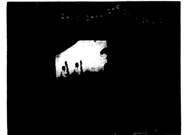
Peringatan hari tanggal 8 kali ini malam kerontjong besar Lembalis... (Caption for the radio broadcast photo)